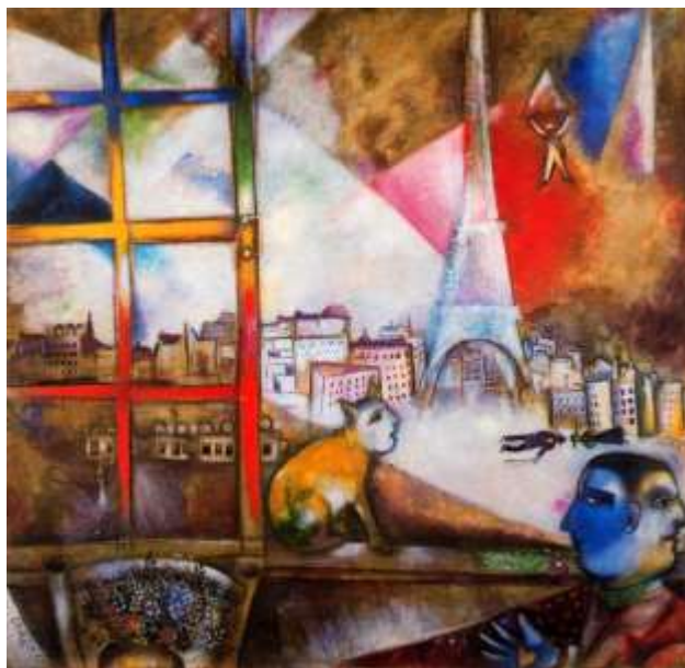
Marc Chagall – Parigi attraverso la finestra