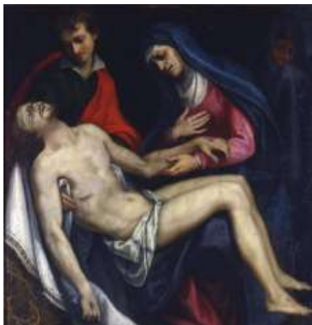
Lodovico Cardi (Il Cigoli) – La pietà

Peccato però che, con il 1865, la suddetta Società venne a cessare 13 la sua attività.