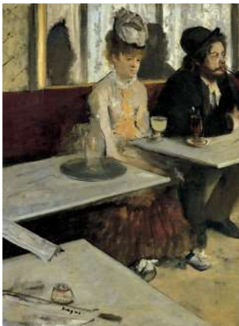
Assenzio - Musée d'Orsay - Parigi - 1876

L'Assenzio è una delle migliori rappresentazioni della vita moderna parigina di quel tempo. I due personaggi si trovano in n